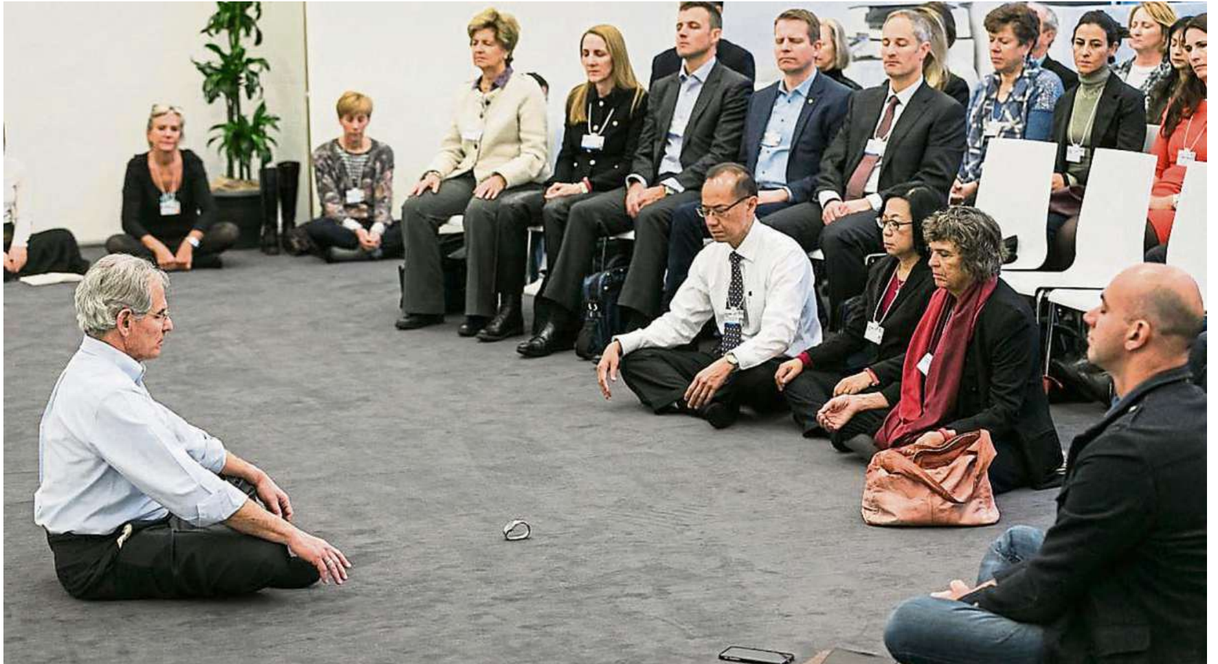
Morgenmeditation in Davos. Jon Kabat-Zinn mit Teilnehmern des World Economic Forum bei der Innenschau, 2015.

Das auch. Das Interesse an Mindfulness-Programmen ist inzwischen deshalb so weit verbreitet, weil seine